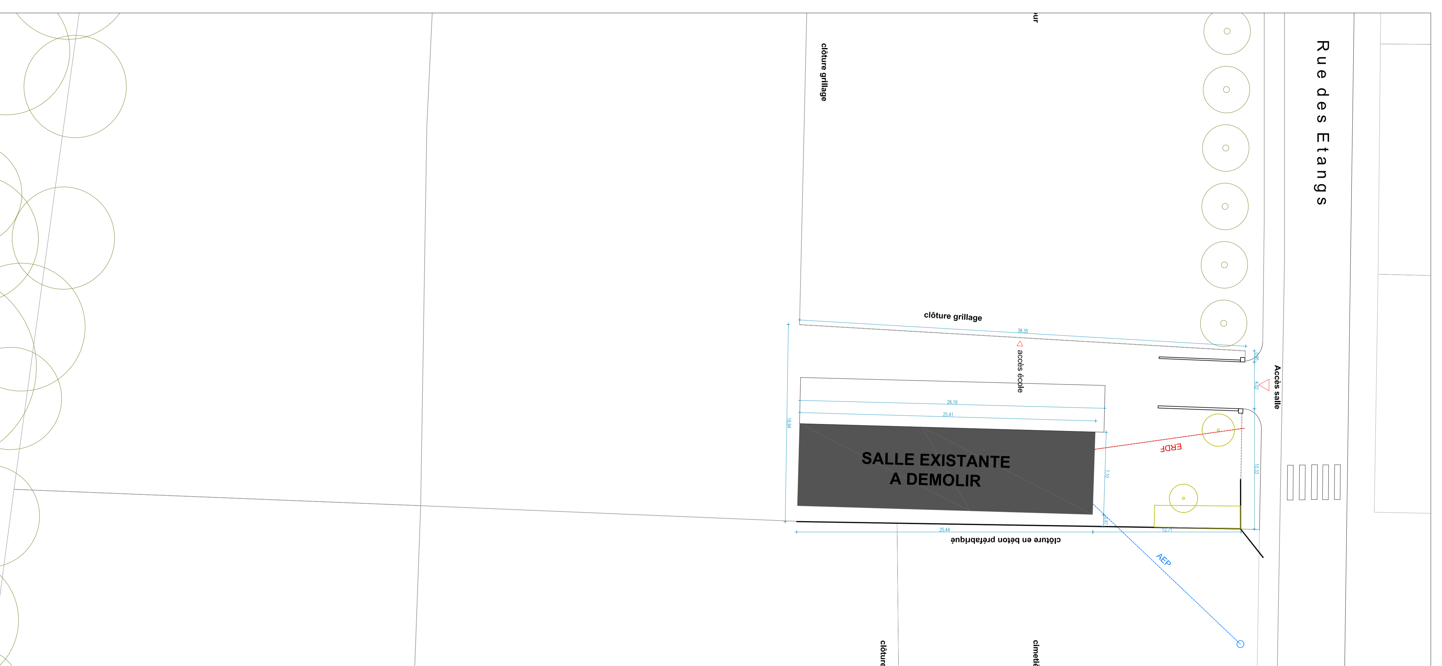
PLAN DE MASSE EXISTANT